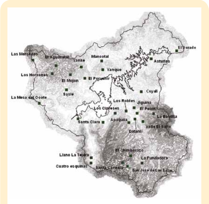
Figura 1. Ubicación de las comunidades priorizadas en la cuenca de Apanás, Nicaragua

Costos de producción.- En este rubro es evidente también la alta variabilidad en las respuestas; hay productores que no invierten en sus