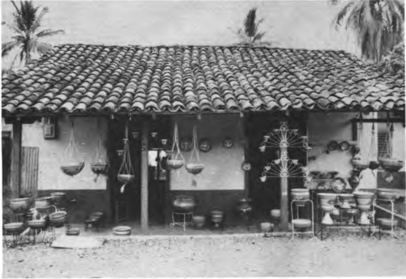
Típico lugar de ventas de cerámica en la pro- vincia de Herrera.