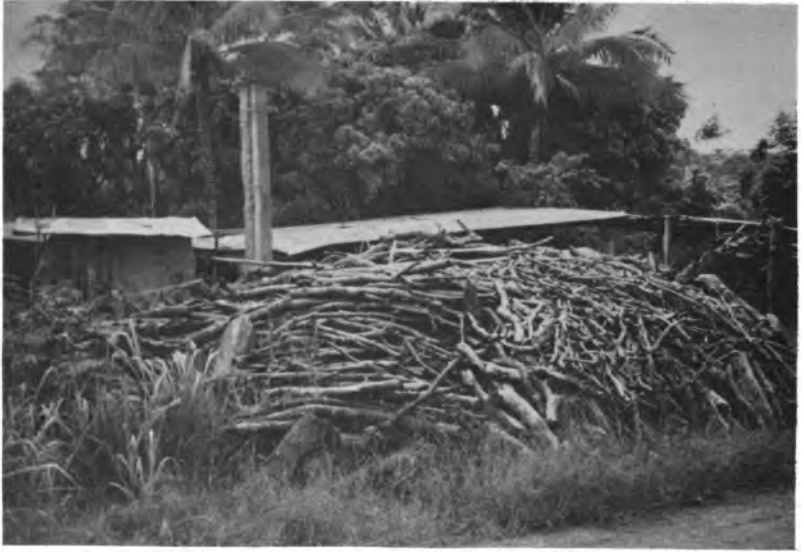
Mediana industria productora de cerámica en la población de la Arena, en la provincia de Herrera.