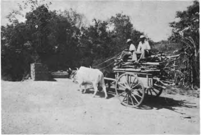
La carretada o carreta es la unidad más frecuentemente usada por las pequeñas industrias. Su precio fluctúa alrededor de B/10.00.