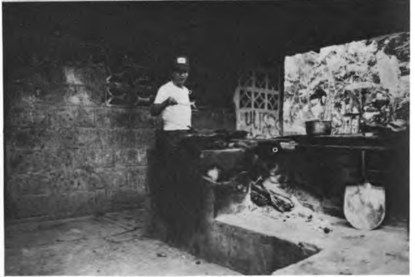
Fondas, kioscos o restaurantes en el interior del país, son permanentes consumidores de leña.