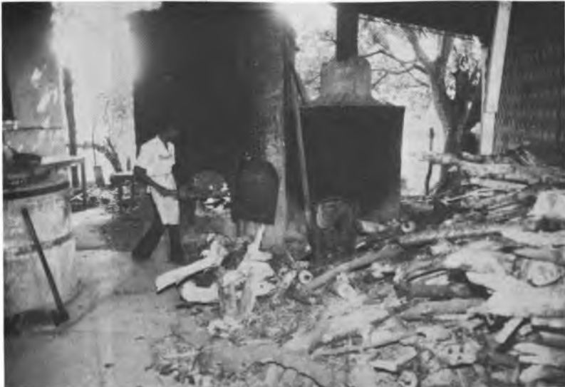
Hornos familiares para la producción de cerámica en la población de la Arena.