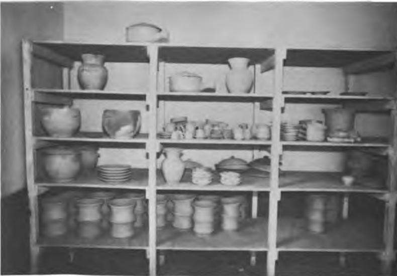
Artículos varios de barro cocido, listos para ser decorados.