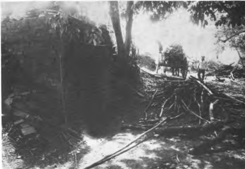
La producción artesanal de ladrillo y tejas es una pequeña industria consumidora de leña restringida a la península de Azuero.