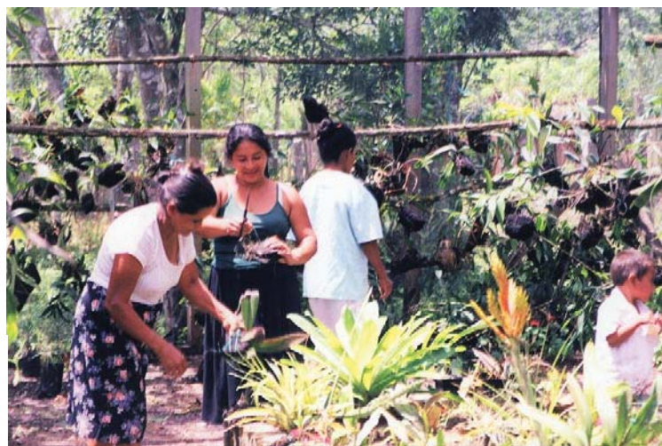
La construcción del orquidario ha permitido la integración de las mujeres de la comunidad a la actividad forestal. Las mujeres se encargan de la propagación y comercialización de orquídeas y otras plantas ornamentales procedentes del bosque

El valor del servicio ambiental de regulación hídrica fue derivado del costo de oportunidad de la tierra, en términos de la ganancia neta reportada por la ganadería extensiva (doble propósito) en las zonas aledañas. Los costos e ingresos de la actividad fueron estimados por medio de entrevistas con productores de Yaruca. Se realizó además un análisis de carácter exploratorio del contexto institucional y del marco legal en materia de recursos naturales, para sustentar futuros acuerdos de pago por servicios ambientales.