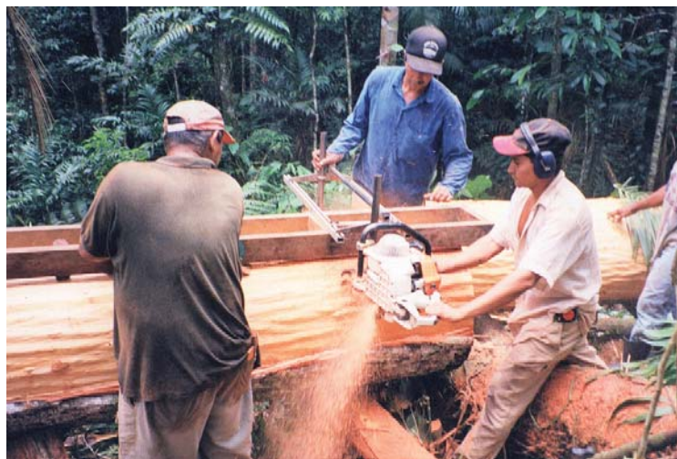
En Toncontín, el aprovechamiento se realiza mediante técnicas de tala dirigida y motosierra con marco para la obtención de madera en bloques

producirían un aumento de más de 9% en los retornos. Debido que el ‘bosque primario’ está en proceso de convertirse en ‘bosque intervenido’, la abundancia y número de especies no maderables pueden variar en este estrato, lo cual causaría un efecto negativo en el aporte que tendrían los PNMB en la rentabilidad financiera de la actividad. Por consiguiente, es recomendable estudiar cómo asegurar la presencia de estas especies en los bosques en proceso de ser intervenidos.