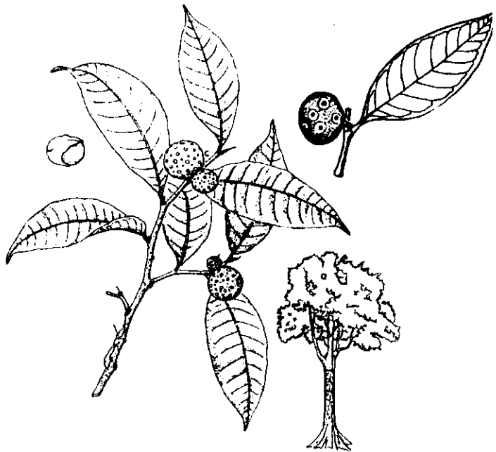
Figura 1. Algunas características botánicas sobresalientes de Brosimum alicastrum .

La madera es pesada a muy pesada (p.e. de 0.63 a 0.87 g/cm 3 ), de color amarillo a castaño pálido. Tiene grano recto a ligeramente inclinado, textura fina, brillo mediano y vetado suave. Es fácil de trabajar y secar, moderadamente difícil de preservar y tiene baja resistencia al ataque de hongos e insectos. Se usa en muebles finos, decoración de interiores, implementos deportivos, mangos para herramientas, pisos, cajas, formaleta, chapas y contrachapados. Su follaje y semillas se utilizan para la alimentación de ganado. El látex y la corteza tienen propiedades medicinales.