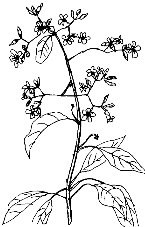
Figura 1. Algunas características botánicas sobresalientes de Cordia trichotoma .

La madera es pesada a muy pesada (p.e. de 0.57 a 0.78 g/cm 3 ). La albura es de color amarillo pardusco y el duramen pardo claro con vetas suaves. Tiene grano recto, textura áspera y brillo alto. Es fácil de trabajar, difícil de secar y preservar y tiene una baja durabilidad natural. Es utilizada en revestimientos decorativos, muebles de lujo, construcción civil, chapas, torneados y carpintería en general. Produce leña de muy buena calidad, es plantada como ornamental y como planta melífera.